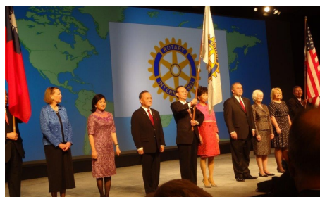
RI President 2014 - 2015 met zijn vrouw en kleinkind