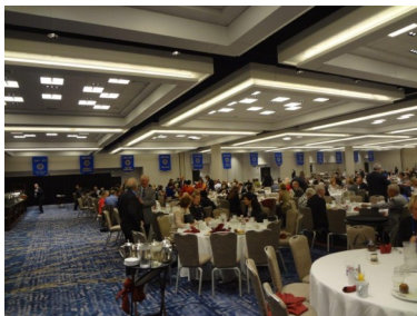
Ontbijt om 7.00 uur